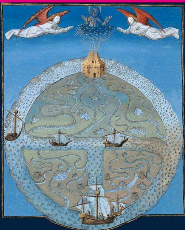
MAPPEMONDE. BARTHÉLÉMY L'ANGLAIS / LIVRE DES PROPRIÉTÉS DES CHOSES (FR. 9140 FOL. 226V) XV e SIÈCLE © BNF

Seront explorés, de l'Antiquité à nos jours, à la fois le voyage des artistes et des œuvres, le voyage des formes et des matériaux et les voyages comme sujets ou objets d'art. Voyage de formation ou départ forcé pour l'exil de l'artiste, œuvres rapportées d'une expédition militaire ou d'un voyage de découverte, pèlerins sur la route des sanctuaires ou amateurs se déplaçant au gré des expositions internationales, le voyage est partie intégrante, depuis longtemps et sous diverses formes, à la fois de la vie de l'artiste, des historiens et des amateurs d'art.